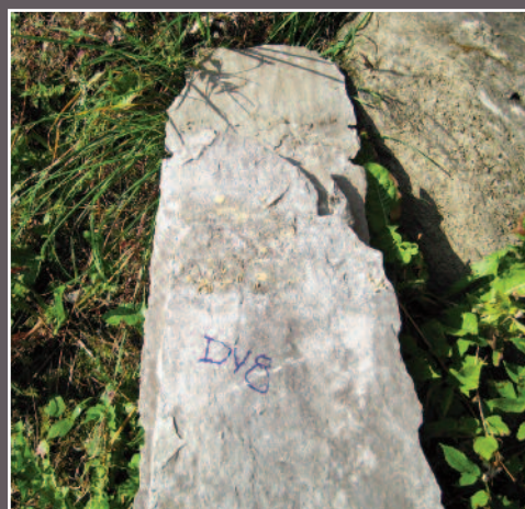
Alle hellene ble merket og lagt tilbake på opprinnelig plass.