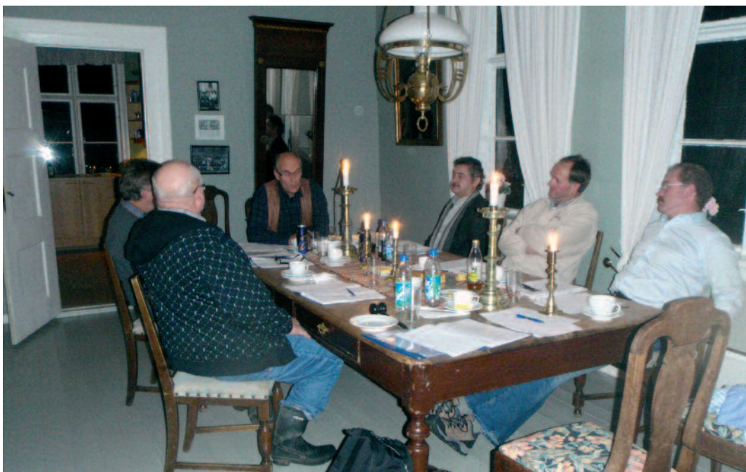
Noen av styremedlemmene samlet i Mellomstuen 6. november 2008.