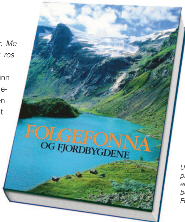
Utstillingen i prestegården er omtalt i boken Folgefonna .