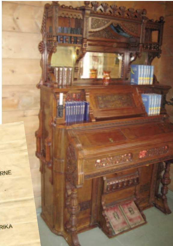
Orgelet er en gave fra Sydnesstrand indremisjon

Fjelberg Kraftlag har lagt fiberkabel frem til prestegården og vil i løpet av neste år sørge for gratis oppkobling.