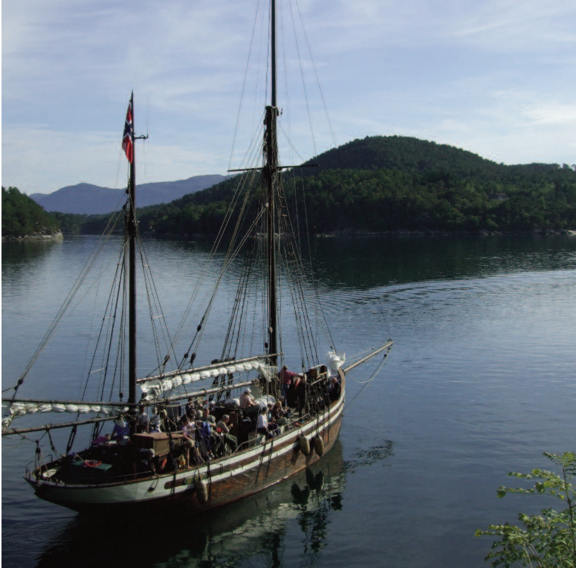
Stord Sogelag hadde leiet veteranbåt for at 35 av medlemmene skulle få omvisning i prestegården