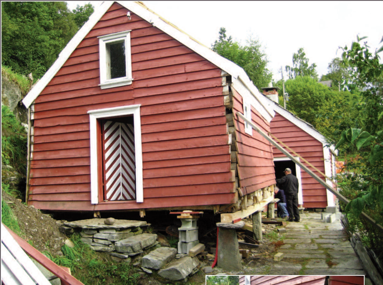
Stabburet ble hevet 30 cm etter at de gamle takhellene var tatt ned.