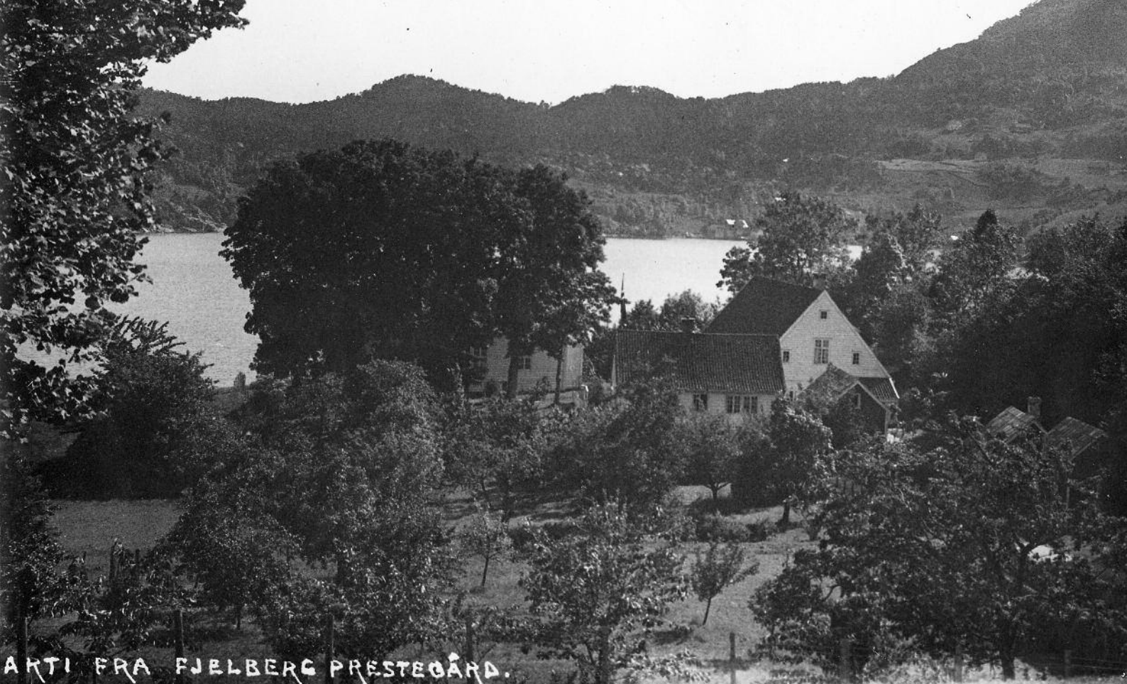
Prestegården på 1800-tallet med Stabburet på opprinnelig plass og vindfang til kjøkkenet før det ble revet i 1930-årene.

Blant de store utfordringene i årene fremover er gjenreising av det tidligere vindfang og lager på nordsiden av Hovedhuset og planlegging av et sprinkleranlegg.