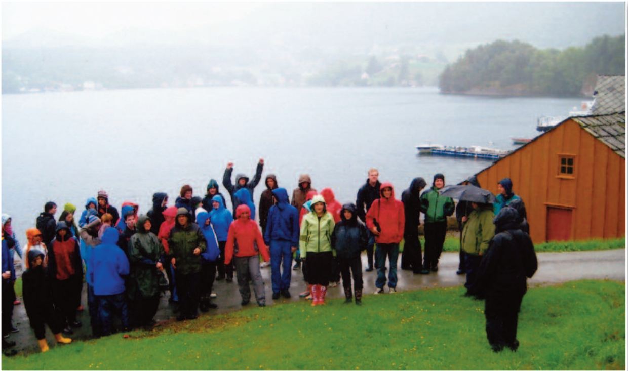
Det ble en våt omvisning for 61 elever og lærere fra Halsnøy Folkehøgskule i slutten av august.