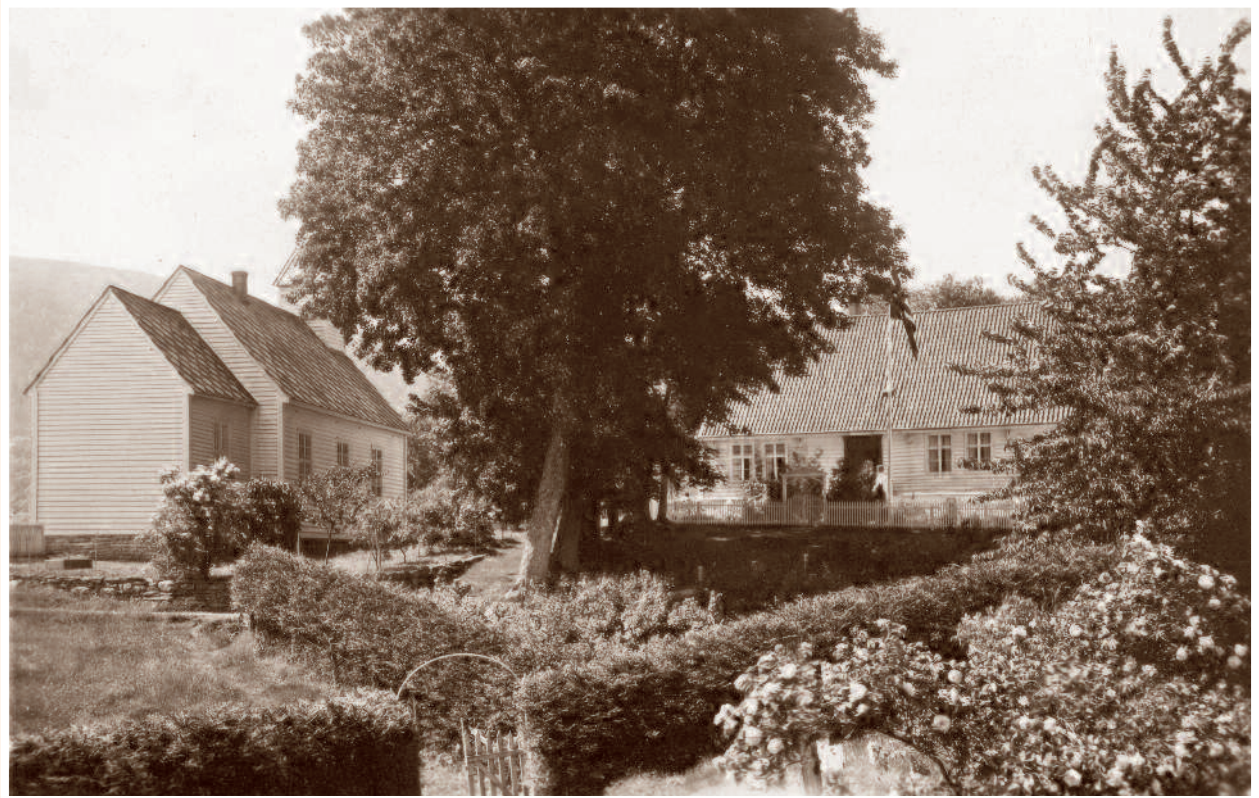
Prestegården med flaggstang og hageport, rundt 1900.