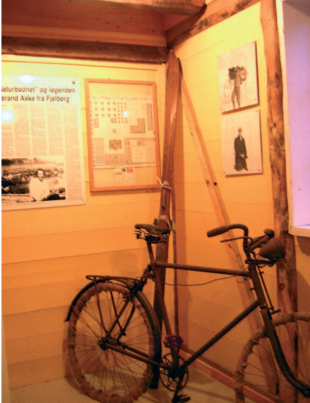
Fra «Tjerand Aske-utstillingen» i Bispestova, Fjelberg prestegard.