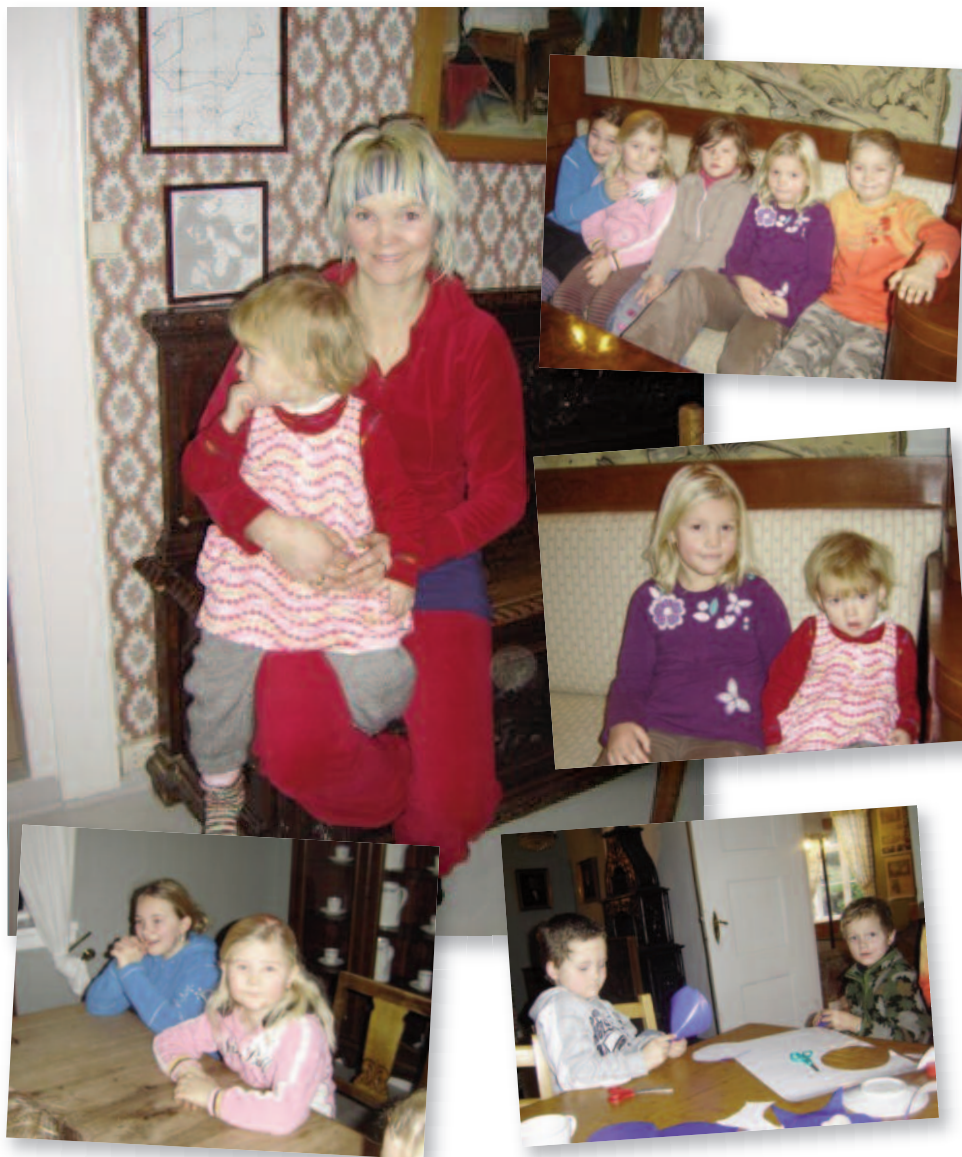
Brekke oppvekstsenter arrangerte adventstilstelning før jul.