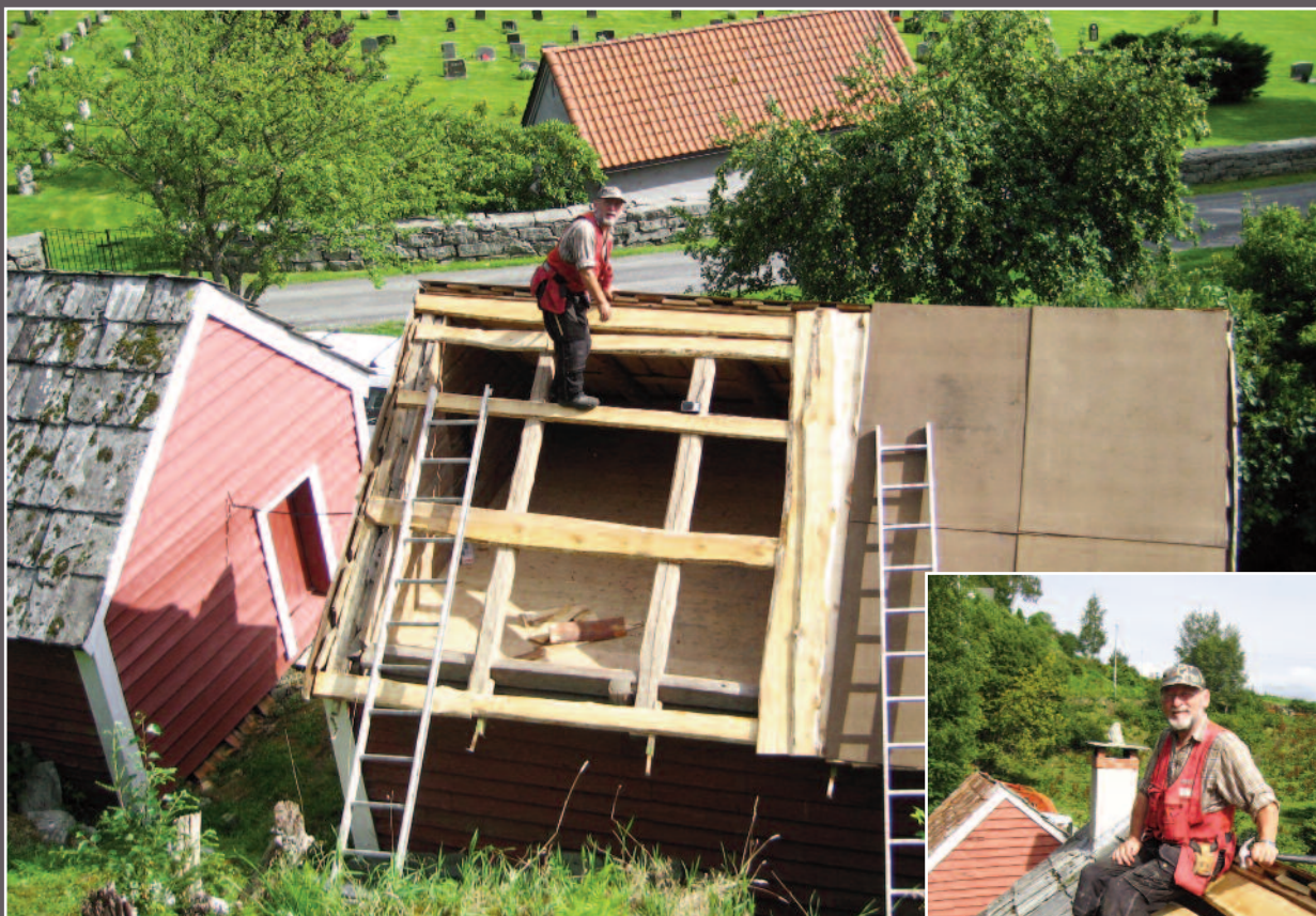
3/4 av taket har her fått nytt sutak og plater.