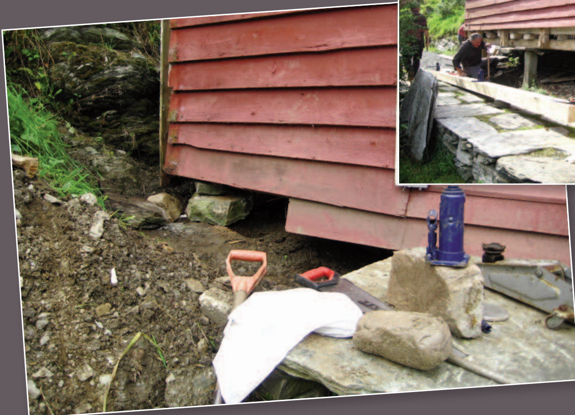
Oppjekkingen av Stabburet bod på store utfordringer. I bakkant var svillen helt smuldret opp.