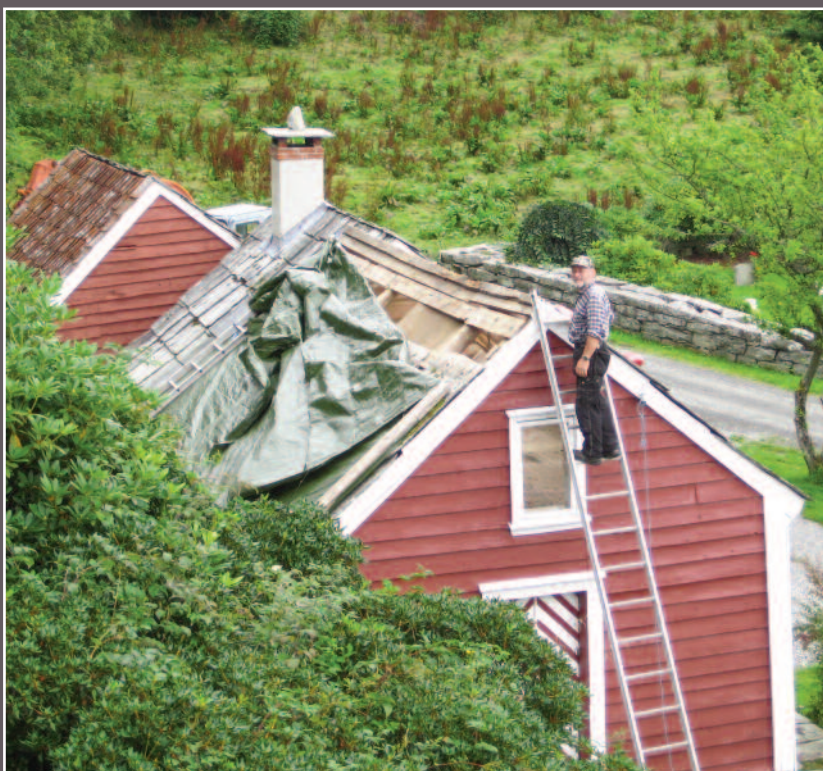
Det måtte sikres mot regn.