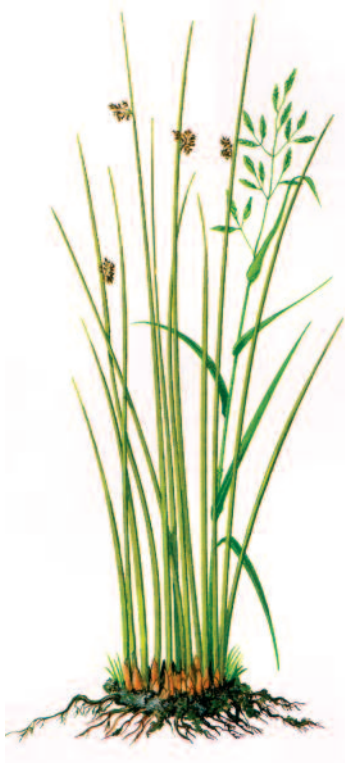
Lyssiv/knappsiv.

Svært mye av Herdis' utvikling i Musikk fra en blå brønn er bestemt av hennes forhold til foreldrene og deres nye partnere og av de innbyrdes relasjonene mellom disse fire voksne. Herdis opplever de voksnes og især moras hemmeligheter og løgner som onde gåter; og disse gåtene leder fram til skilsmissten. Men også etter samlivsbruddet er de voksne i ubalanse, og deres ustadige og uberegnelige oppførsel mot Herdis fører til stadig nye kriser og ofte dramatiske situasjoner. Et nytt vendepunkt kommer mot slutten da Herdis flytter fra faren til mora og Elias. Hos stefaren finner hun en støtte og omsorg som faren aldri har gitt henne. Skjønt forholdet til mora fortsatt er konfliktfylt er Herdis mot slutten av romanen bedre rustet til å ta imot nye gåter i møtet med det voksne livet som hun snart står på terskelen til i sin egen utvikling.