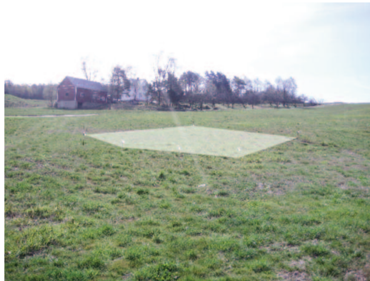
Kolerakirkegården i Nordhusvågen på Fjelberg.